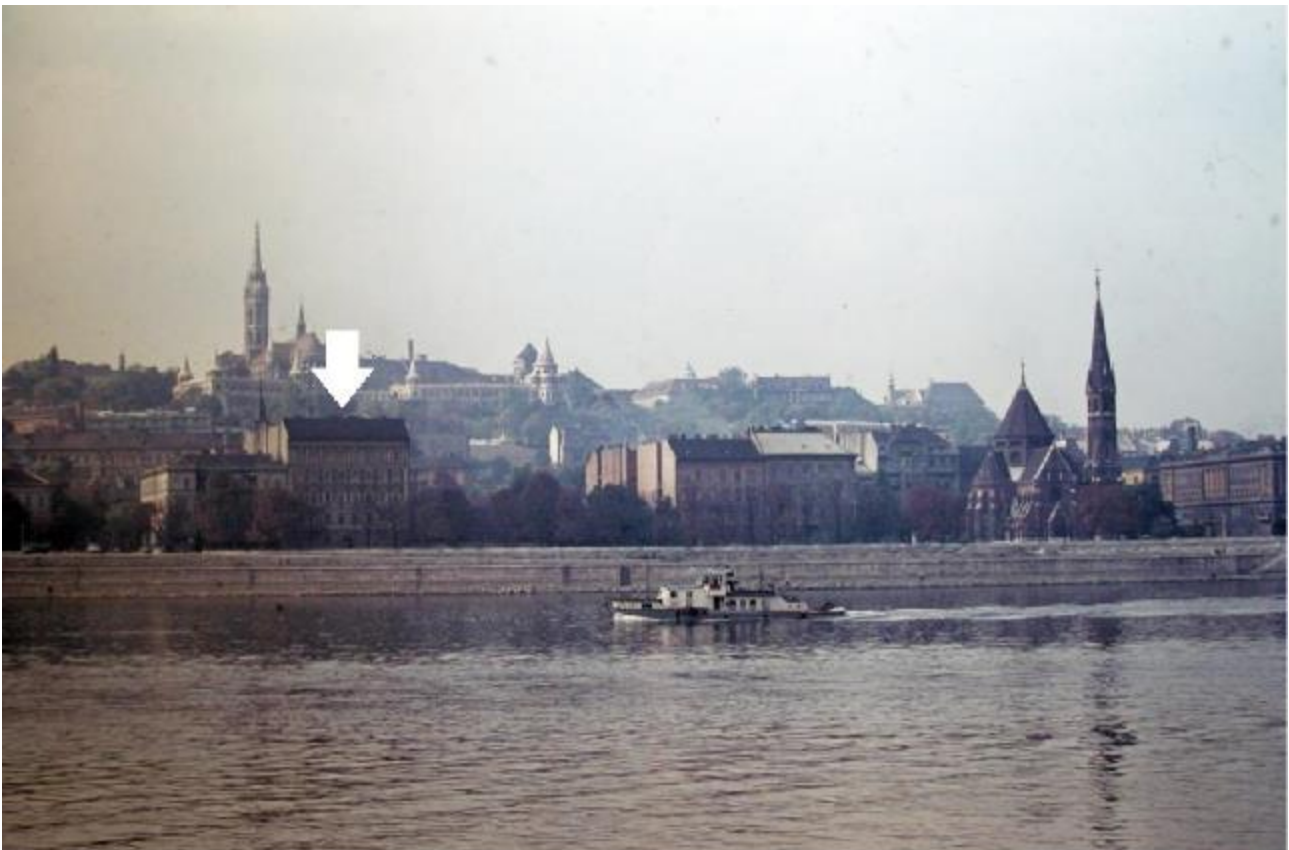
Bem rakpart a Dunáról - 1970

Számos népszerű földrajzi munka szerzője volt. Részben saját kutatásai alapján részlettanulmányokat és összefoglaló műveket írt a Föld megismerésének történetéről. Részt vett a Magyar Földrajzi Társaság munkájában és vezetésében, 1896-1906 között szerkesztette az első részletes hazai atlaszt, a Nagy Magyar Atlaszt. Számos történeti térképpel, iskolai atlaszsal járult hozzá a magyar kultúra műveléséhez.