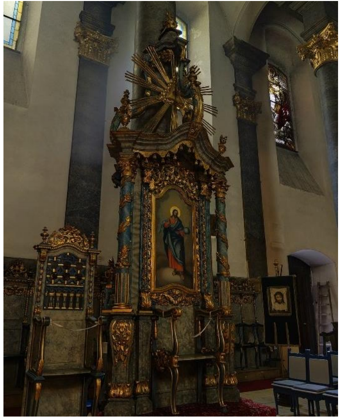
13. kép: A püspöki trónus