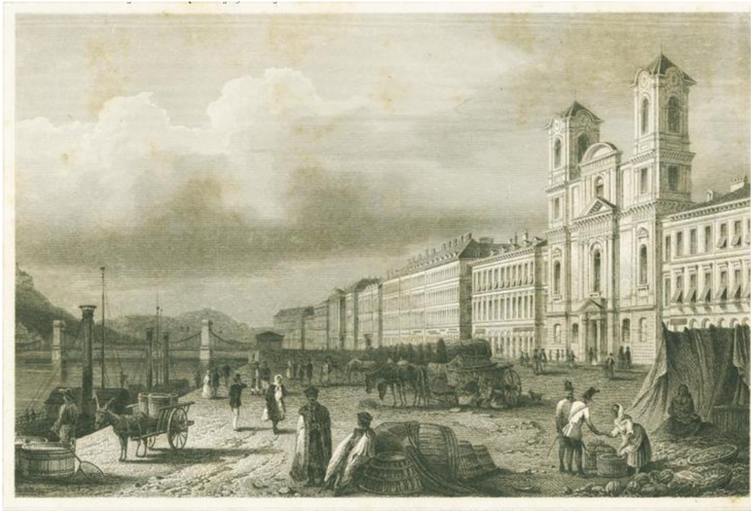
1. kép: Ludwig Rohbock, A görög egyház az Aldunatoron , 1850, grafika. (FSZEK, Budapest Archivum)