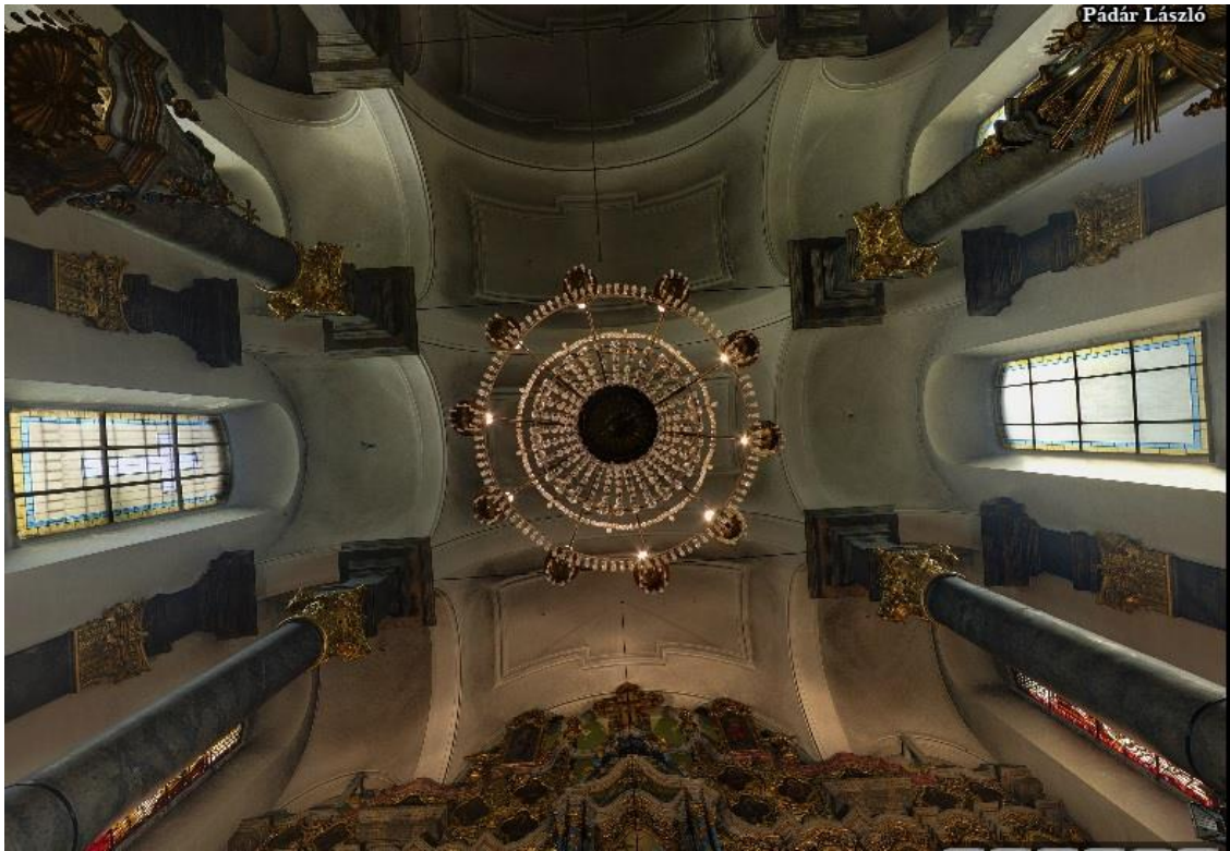
11. kép: A mennyezet