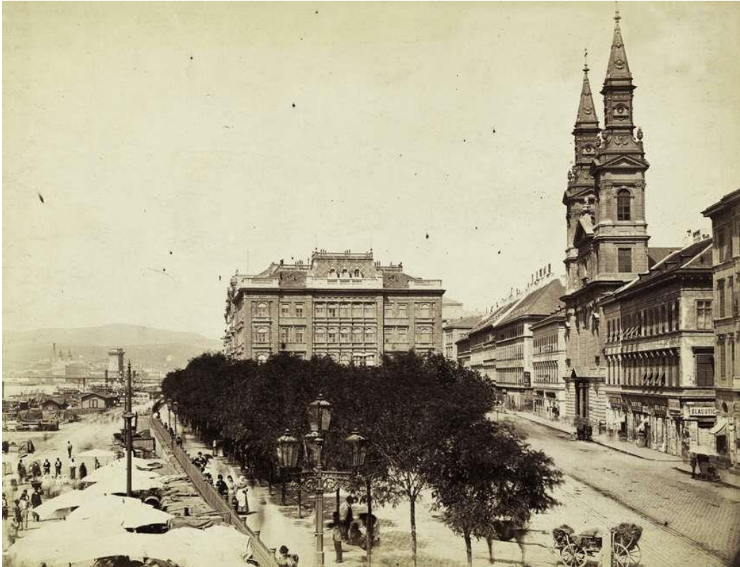
3. kép: Klösz György, Petőfi tér, 1900.