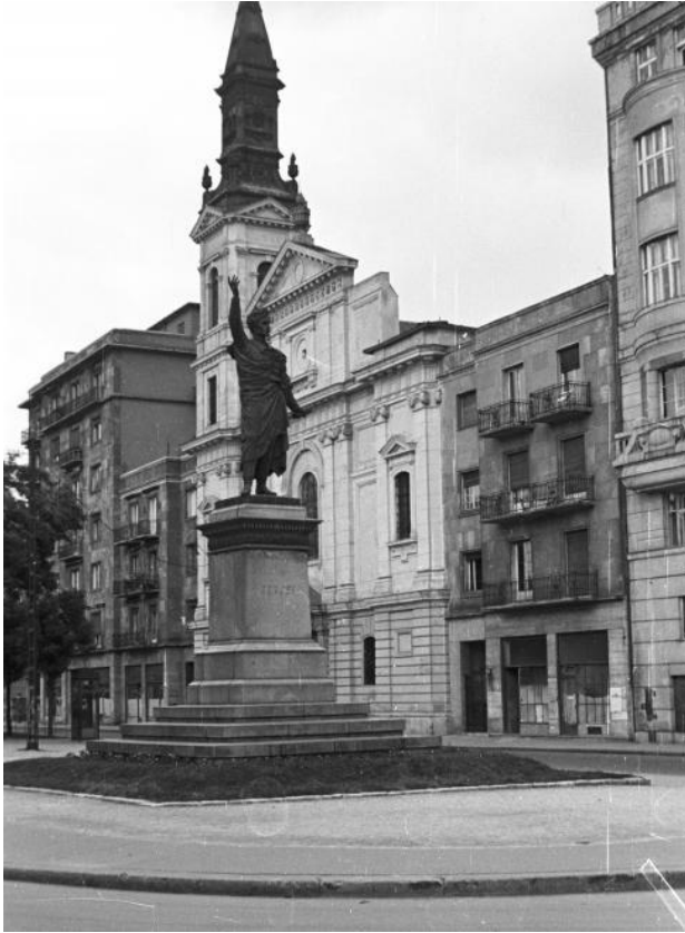
5. kép: Szent-Tamási Mihály, A Nagyboldogasszony templom fél toronnyal, 1954.