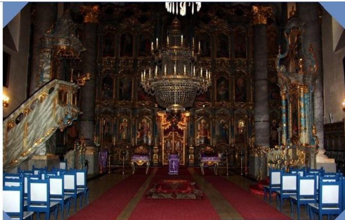
10. kép: A templom belsejére a templom közepén állva, az ikonosztázián felé nézve