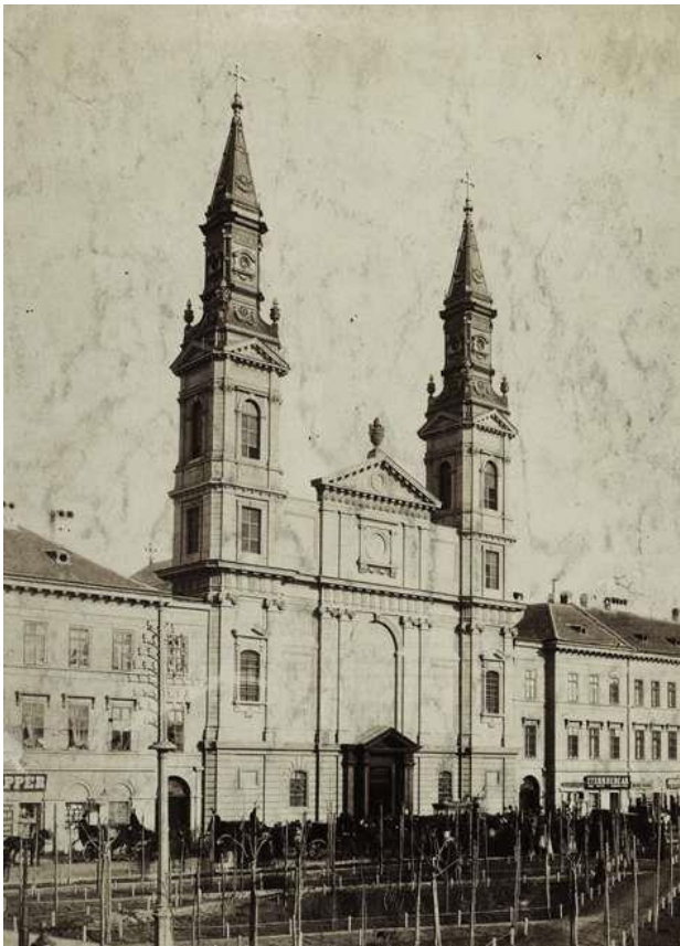
4. kép: Klösz György, Petőfi téri Nagyboldogasszony templom, 1900.