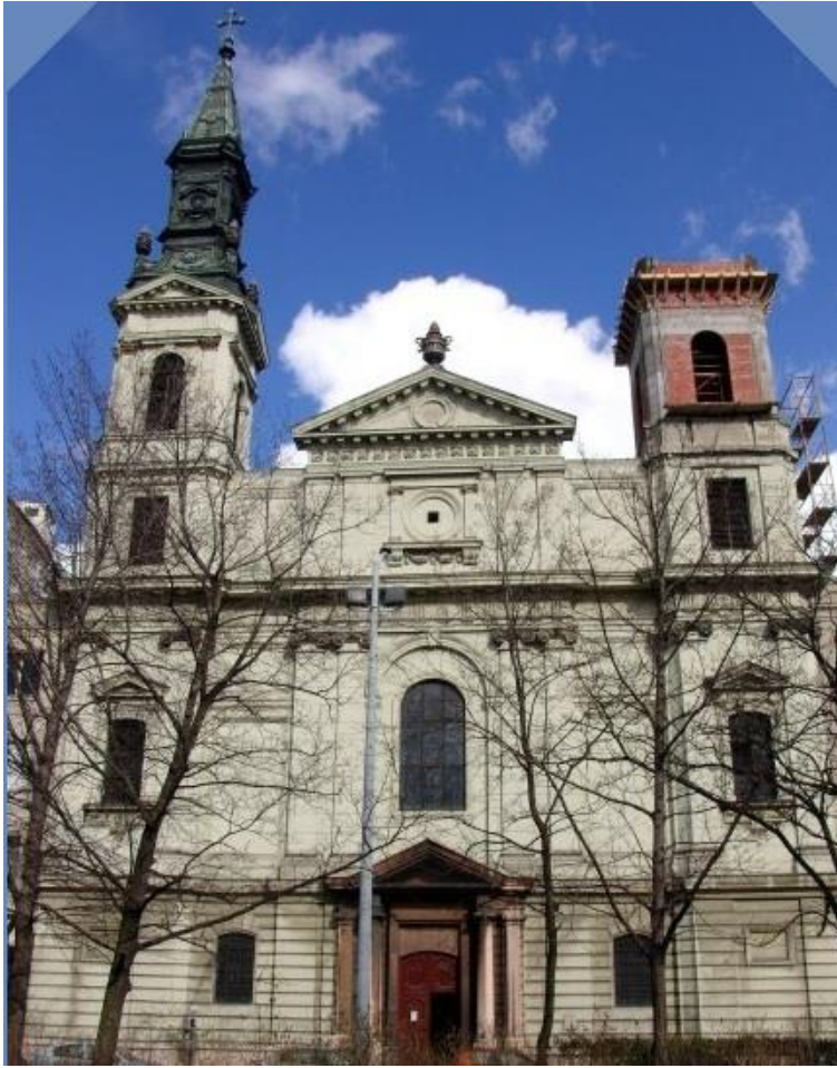
7. kép: Épülő toronnyal, 2009. ( http://nagyvofely.hu/budapest,+v.+kerulet/templomok )