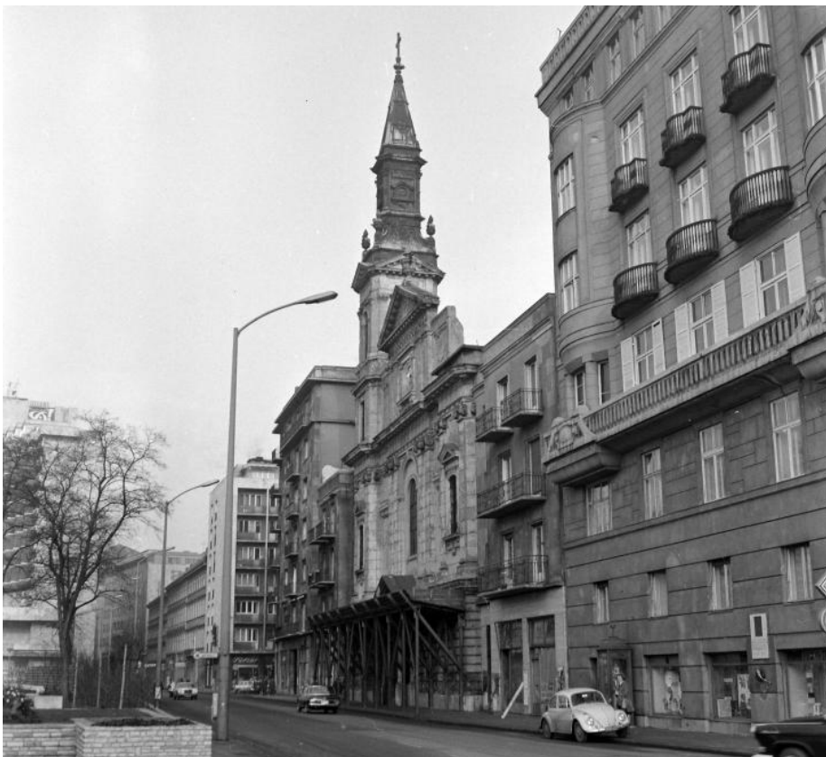
6. kép: A Nagyboldogasszony templom fél toronnyal, 1973.