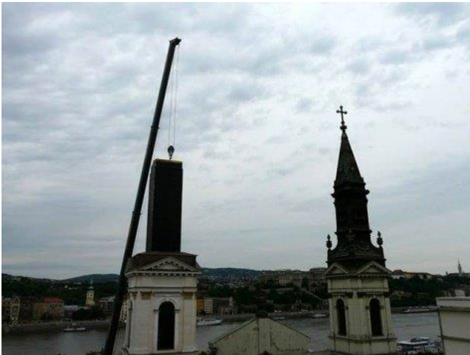
8. kép: A bádogsisak ráemelése a déli toronyra, 2010. március 15. ( https://kuruc.info/r/2/61320/ )