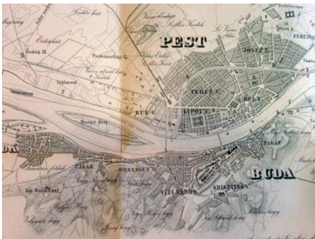
A Pest és Buda között húzódó Duna-meder

A Nagykörút a város többi részéhez képest mélyebben helyezkedik el, ugyanis az ókorban ezen a